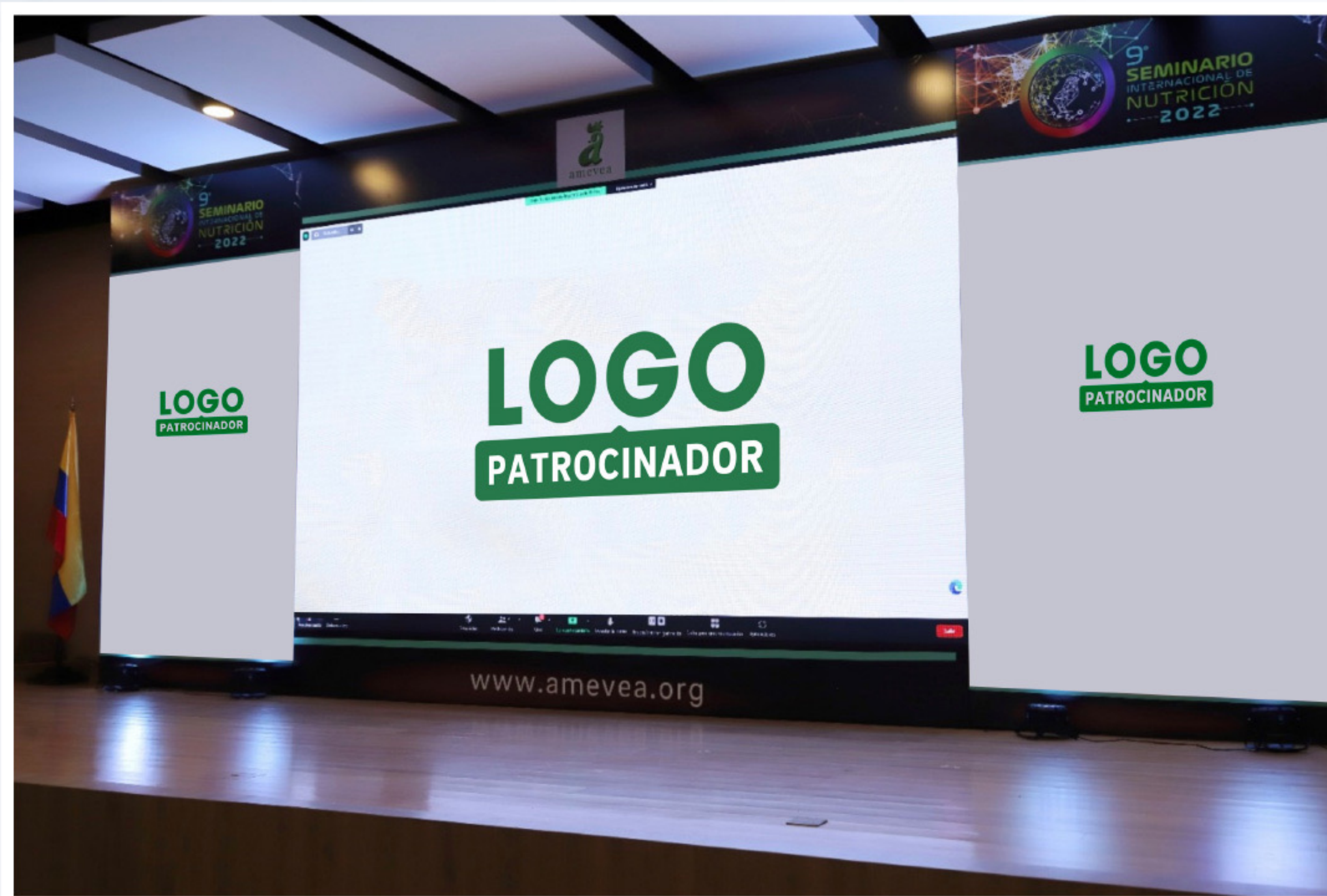
EXHIBICIÓN DEL LOGO EN TARIMA EN LA CATEGORÍA DIAMANTE