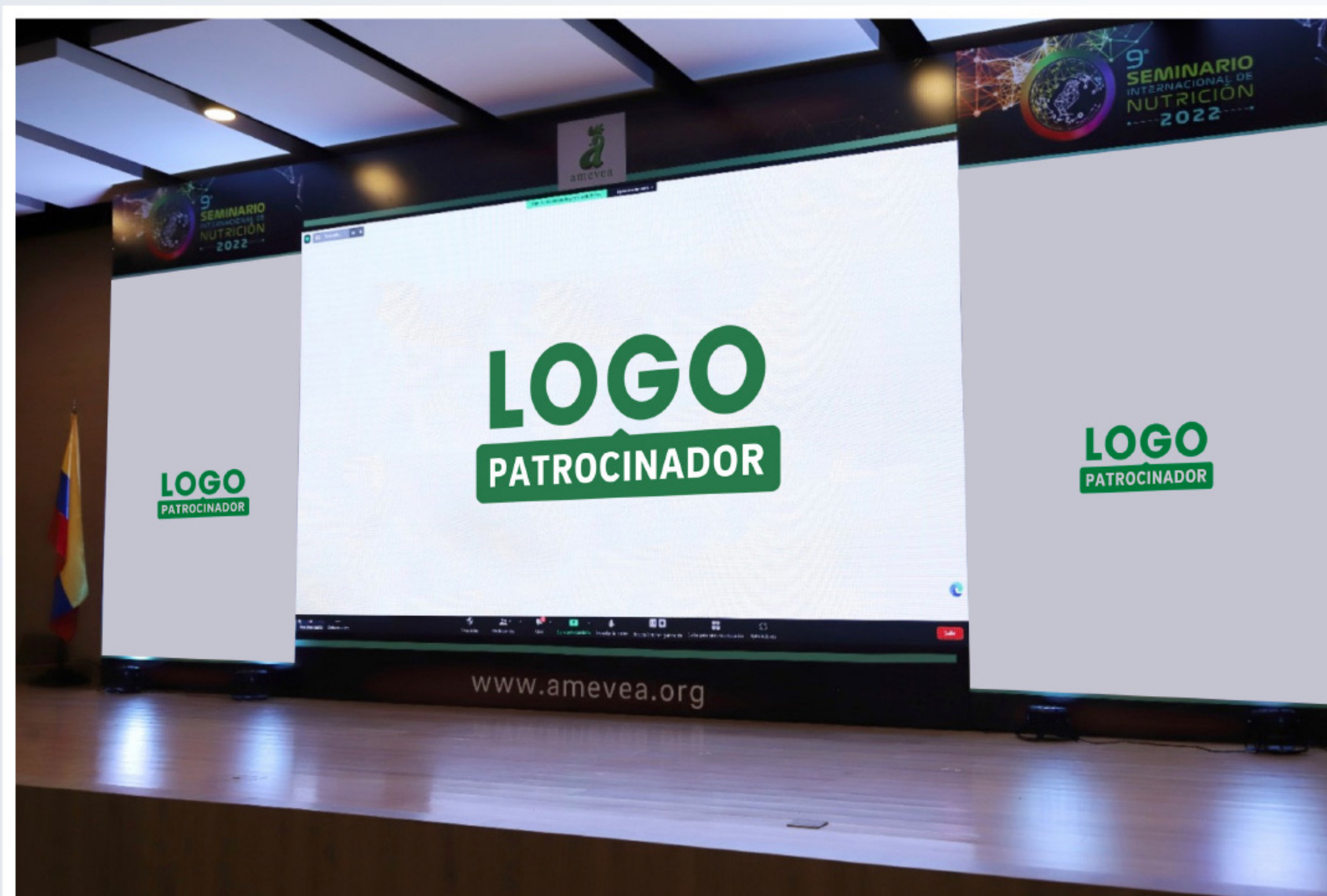
EXHIBICIÓN DEL LOGO EN TARIMA EN LA CATEGORÍA PLATINO