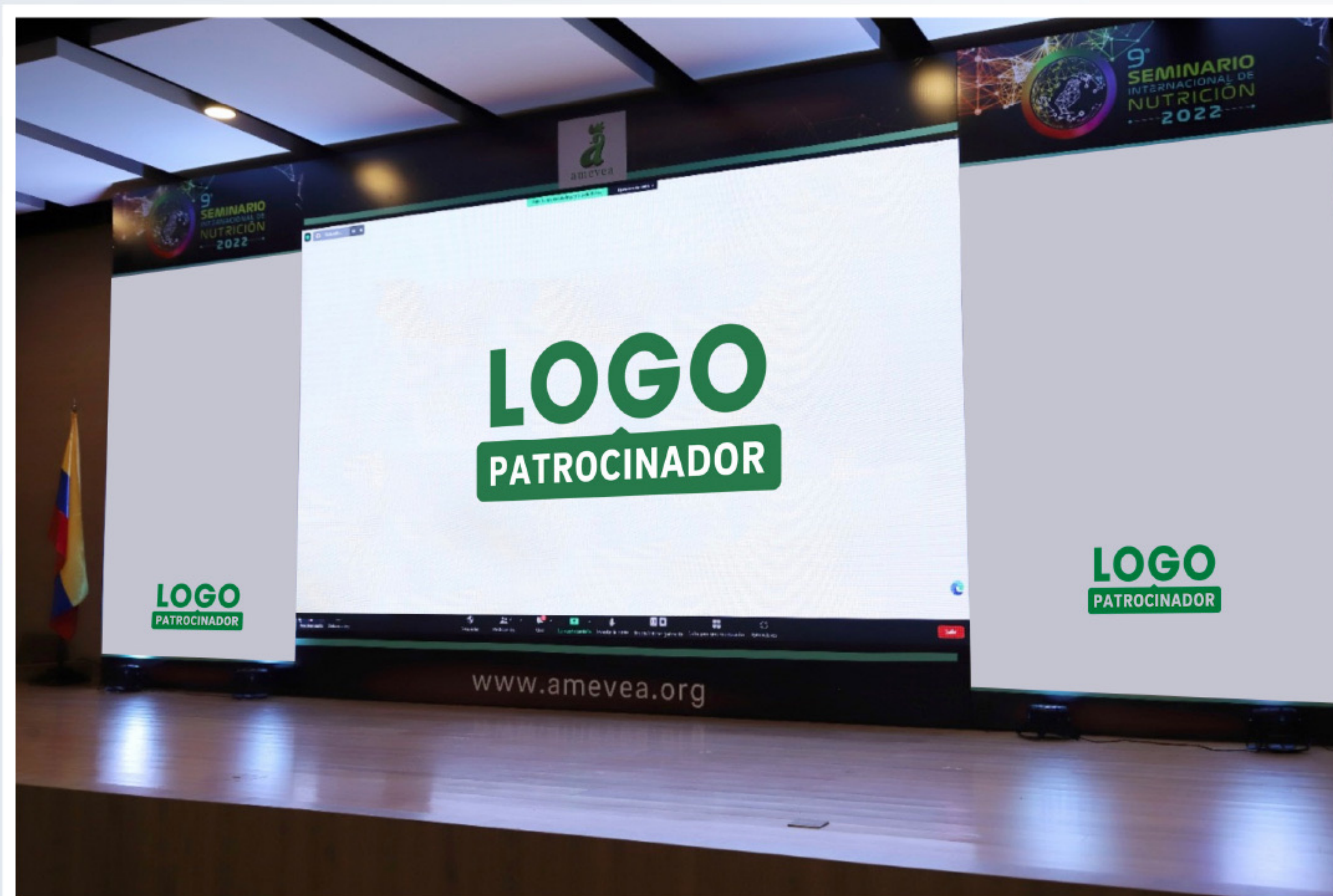
EXHIBICIÓN DEL LOGO EN TARIMA EN LA CATEGORÍA ORO